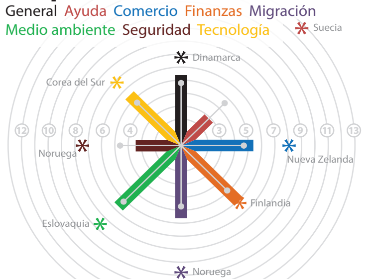
Cambio de España con el transcurso del tiempo, 2003-2013 (media 5 = 2012)